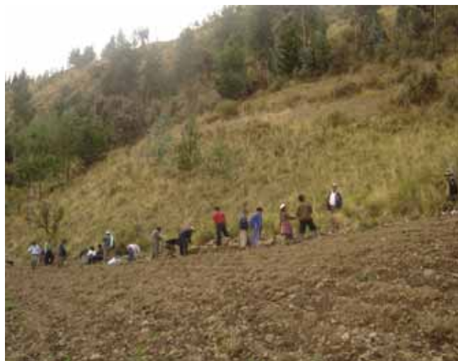
Los participantes de la evaluación en la comunidad

Estratado de la memoria de la evaluación del curso Ecoproducción Nivel A septiembre 2006 en la comunidad Entre Rios Tacuaral, provincia Carrasco, Cochabamba.