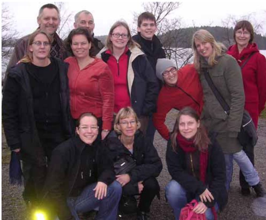
Nuestros compañeros de la escuela popular en Färnebo nos desean un año nuevo muy prospero