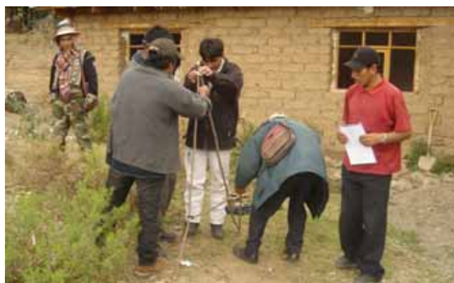
“El curso nos ha servido para organizarnos mejor, antes el trabajo no era comunitario”