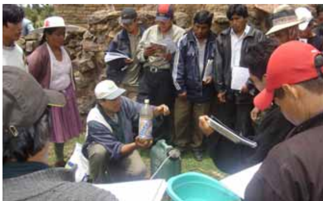
“La fotografía nos ayudaría y sería mas apreciado por la comunidad”

-Para mi sería aprender como lo hemos hecho tiene muchas ventajas, pero ir a los mismos