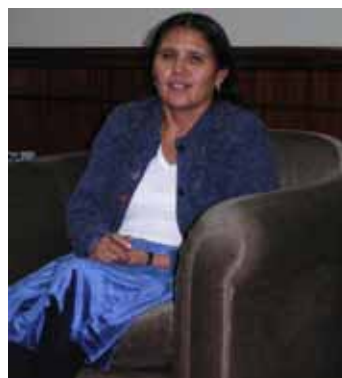
La ex-ministra de Justicia

El Gobierno ha aprobado un proyecto de ley de justicia comunitaria que tiene el objetivo de poner al mismo nivel que los procesos judiciales ordinarios, las costumbres y normas aplicadas por tradición por los pueblos originarios.