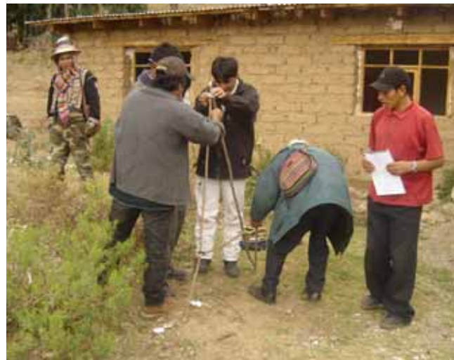
“Kursen har hjälpt oss att organisera oss. Tidigare arbetade vi inte i gemenskap”