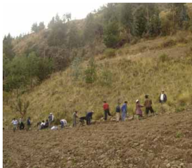
Deltagarna lär känna jordbruket i andra delar av landet än sin egen

Utdrag ur en utvärdering av kursen ekoproduktion nivå A från september 2006 i Entre Rios Tacuaral, provinsen Carrasco i Cochabamba.