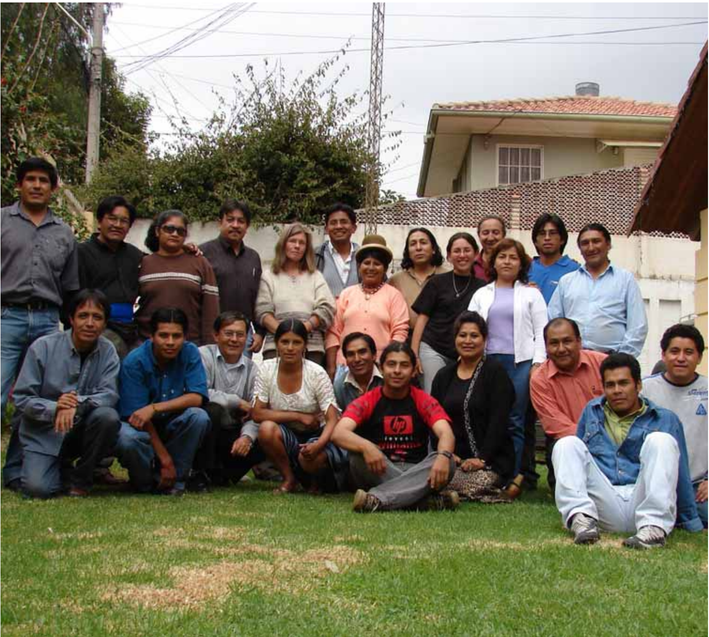
Kawsay önskar er alla en god fortsättning på det nya året.

Kondoren symboliserar motstånd mot förtryck och är också symbolen för enighet bland det andinska folket, frihet och styrka.