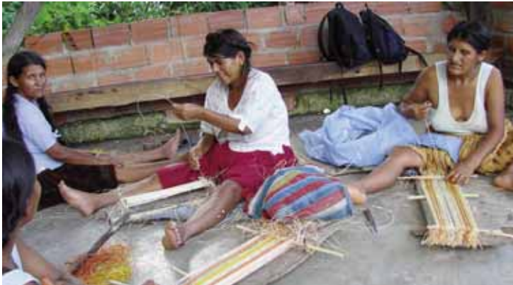
Así se aprende en el trópico Chapareño