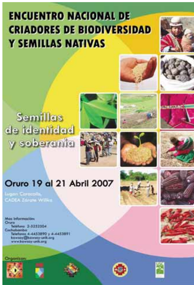
Un encuentro organizado por Kawsay

Más información: Oruro: telefono 2-5252504 Cochabamba: telefono 4-4453890, 4-4453891